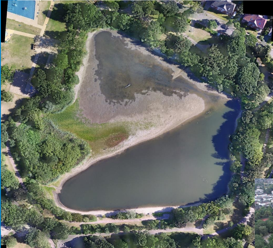
Juli 2019 nach der Entschlammung